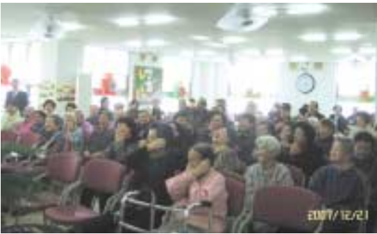
열심히 웃으며 레크레이션을 따라하고 있는 모습