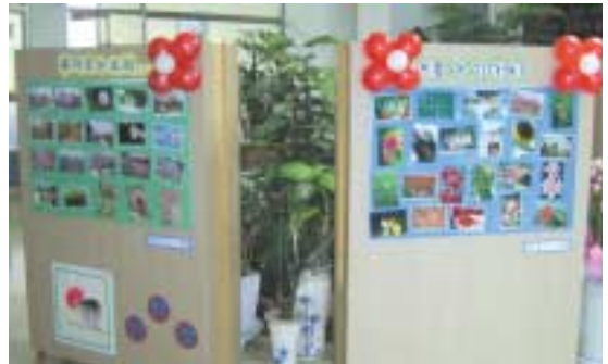
김성보 어르신의 사진작가 못지않은 꽃을 주제로 한 계절별 테마사진