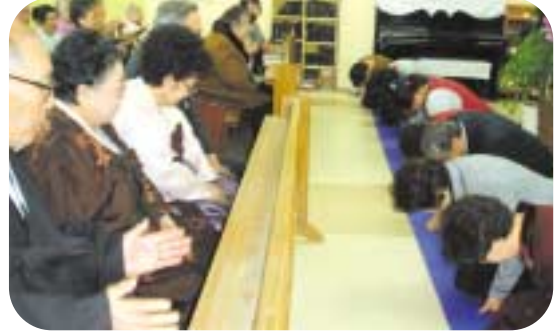
어르신들께 세배 드려요~!

명절 분위기를 한층 돋우게 만들었던 것은 옷놀이 척사대회였다. 그린힐에서는 어르신들이 많이 참석하는 명절 전인 5일에 실시를 하였고, 요양원에서는 6일에 실시를 하였다. 옹기종기 모여앉아 “옷이야~모야~!”, “개 잡아라, 걸 나와라~!” 하며 여기저기서 서로 열심히 옷놀이에 열중하며 온 국민의 큰 명절인 설날을 어르신들과 직원이 한 자리에 모여 따뜻하게 보내는 시간이 되었다.