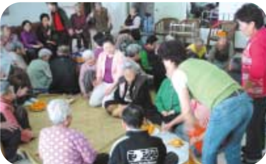
옷을 던지신 후 옷말을 어떻게 놓을지 고민하는 그린힐 어르신들

명절 분위기를 한층 돋우게 만들었던 것은 옷놀이 척사대회였다. 그린힐에서는 어르신들이 많이 참석하는 명절 전인 5일에 실시를 하였고, 요양원에서는 6일에 실시를 하였다. 옹기종기 모여앉아 “옷이야~모야~!”, “개 잡아라, 걸 나와라~!” 하며 여기저기서 서로 열심히 옷놀이에 열중하며 온 국민의 큰 명절인 설날을 어르신들과 직원이 한 자리에 모여 따뜻하게 보내는 시간이 되었다.