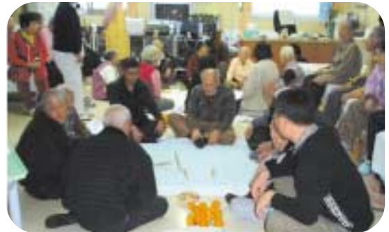
옷이 어떻게 나왔나 보고 계시는 요양원 어르신들