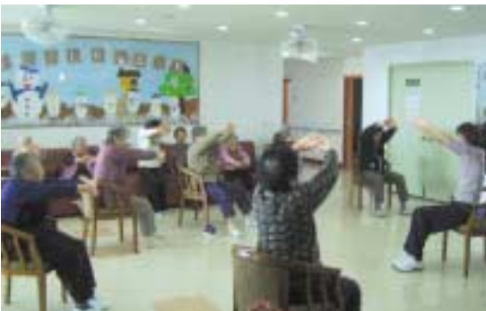
열심히 지도하시는 강사님