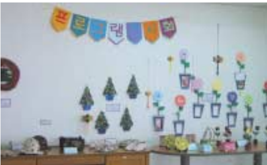
프로그램시간에 어르신들이 손수 만든 작품들

행사가 끝나고 돌아가실 때에는 프로그램 작품들과 입주자 김성보 어르신의 사진전시 작품들을 감상하고 기념품을 받으셨다. 처음으로 하는 행사이기 때문에 부족한 점도 있었지만 여러 가지로 의미가 있었고, 내년에도 계속 진행하려 한다.