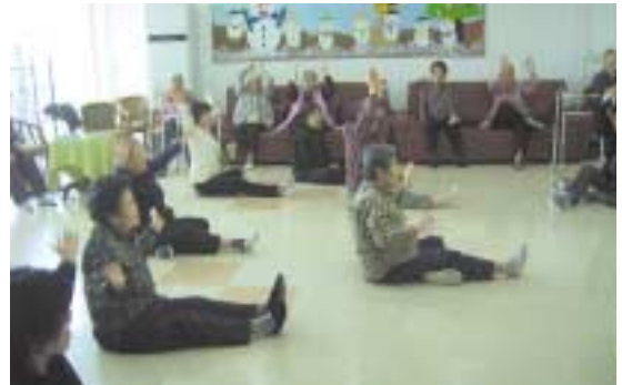
즐겁게 따라하시는 어르신들

항상 어르신들의 건강을 위해 생활체조에 열정과 정성을 쏟으시는 강사 선생님께 감사드리고요~, 우리 한나원에 계시는 모든 어르신들이 항상 건강하시고 웃음이 넘치는 활기찬 생활이 되시기를 간절히 바랍니다.