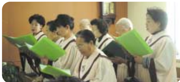
요양원 성가대의 아름다운 특송 모습