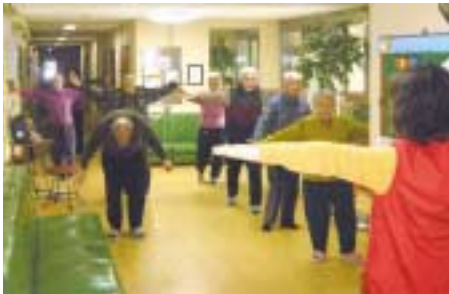
은국민이 건강할 때 까지...국민체조 하시는 어르신들

국민보건체조가 끝나면 직원의 구령에 따라 박수 20번을 힘차게 친다. 박수는 혈액순환에 좋고, 우렁찬 박수 소리는 새 힘을 주는 것 같다. 그 다음에는 노인체조를 어린이가 부르는 “고향의 봄” 노래에 맞추어 춤추듯 여러 가지 동작을 한다. 체조를 하다보면 어느덧 마음은 동심으로 돌아가고 몸은 나비가 된 듯 가벼워진다.